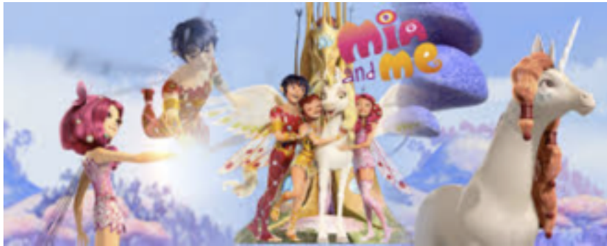
Mia ,Mo ,Yuko ,Onchao.